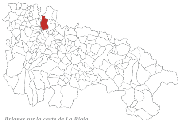
Briones sur la carte de La Rioja

BRIONES est situé au cœur de La Rioja Alta, à 502 mètres d'altitude. Sur ces terres, on cultive une superficie de 1400 hectares de vignoble appartenant à l'AOC de la Rioja. Cela en fait l'une des communes avec la plus grande tradition viticole au sein de la région. La prédominance de ses influences climatiques est océanique, et les vendanges se font généralement vers la première semaine d'octobre.